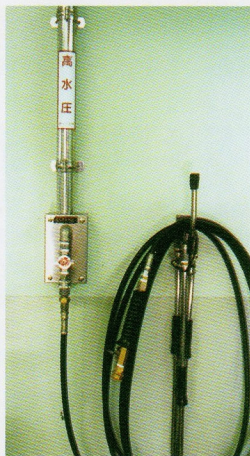
(高圧ワンタッチ着脱金具)